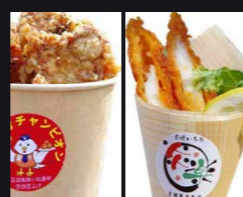
炎楽 小牧航空自衛隊寄揚(空自空上げ) 西尾名物 有料 イカフライのレモン煮