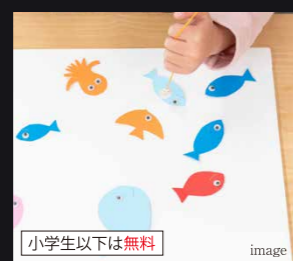
○ミニゲーム ・魚釣りゲーム、輪投げゲーム ・ミニ抽選会