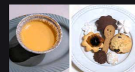
イタリア菓子 有料