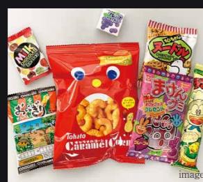
○子供向けお菓子の販売 ○飲料水の販売 有料