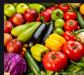
○生鮮野菜の即売 有料