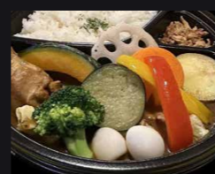
ハートビート スープカレー、 たこ焼きetc. 有料